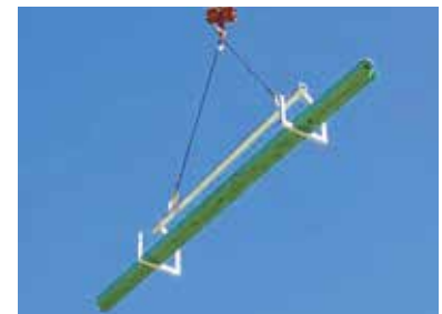
Alu-Langgutgabel LG 3000