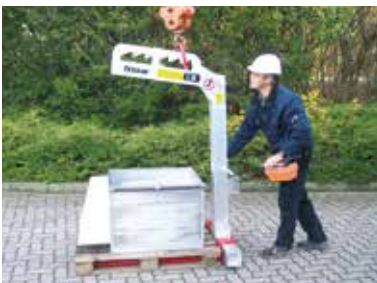
Alu-Palettengabel PG 1000 A