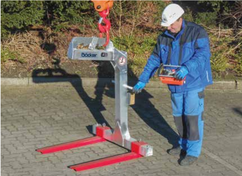
Alu-Palettengabel PG 600 A