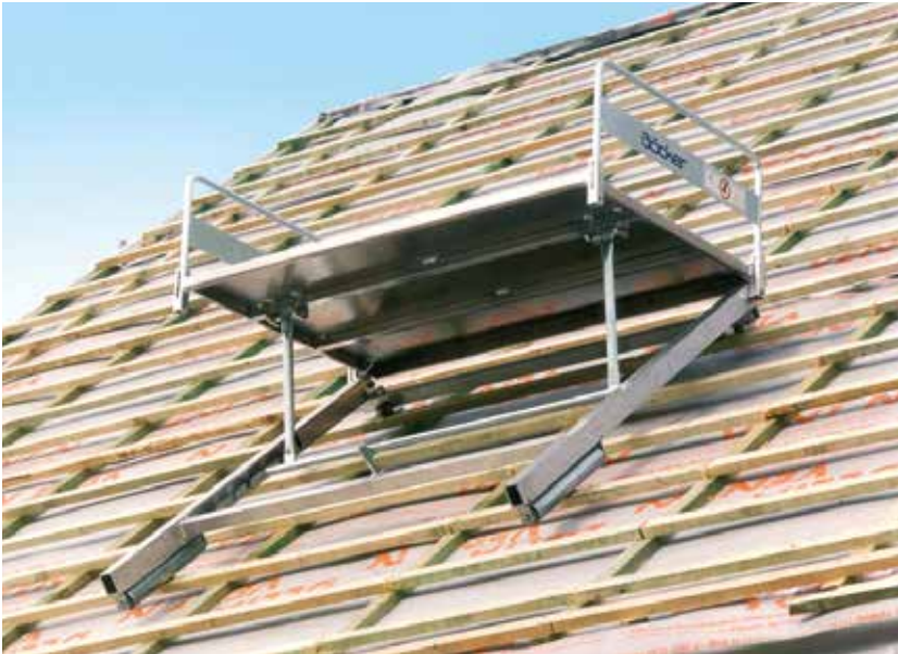
Alu-Dachziegelverteiler DZV 400 für Krane