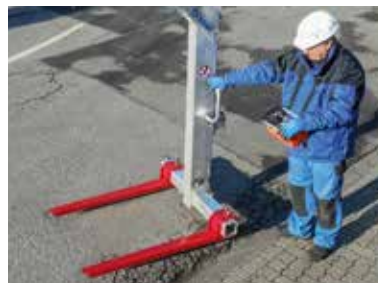
Alu-Palettengabel PG-A-1800 A