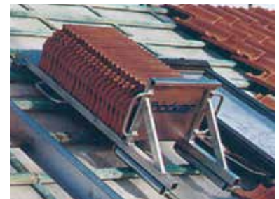
Alu-Dachziegelverteiler DZV 200-F für Aufzüge