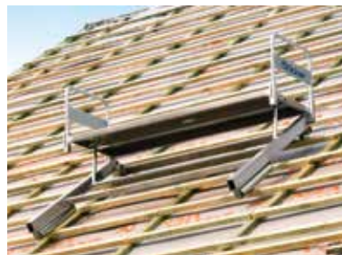
Alu-Dachziegelverteiler DZV 200 für Krane