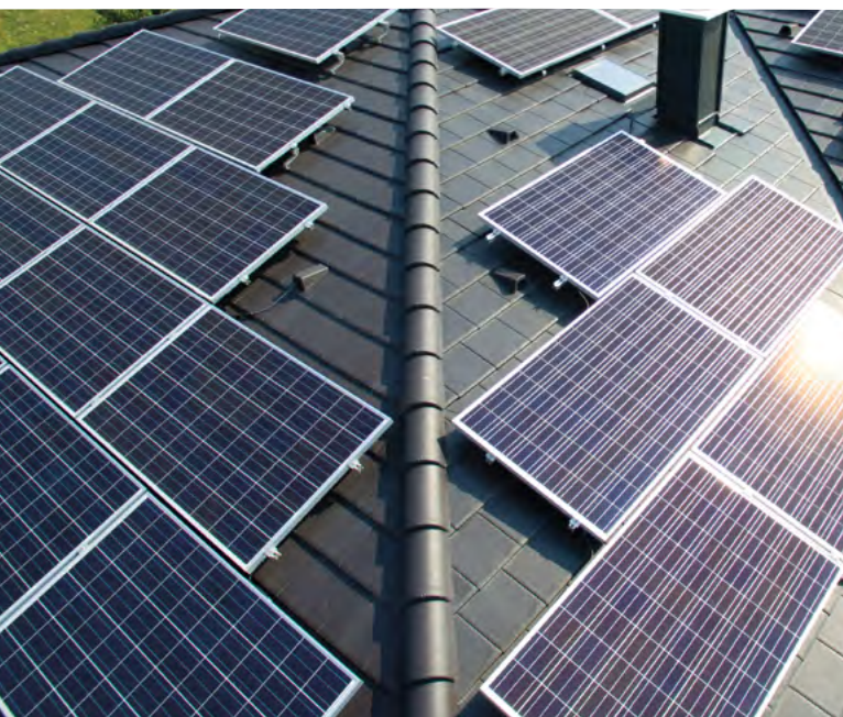
Klasszikus, nagypaneles szolárrendszer

A megoldás a Terrán Generon! Ugye látja a különbséget? Ilyen lenyűgöző látványt élvezhet minden egyes nap, évtizedeken át, ha a Generon mellett dönt.