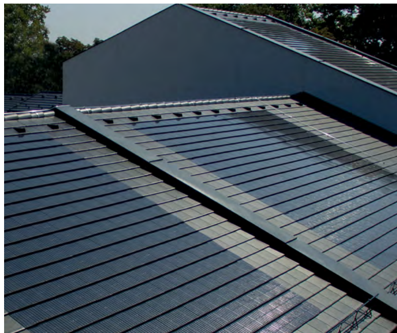
GENERON a naprakész tetőcserép