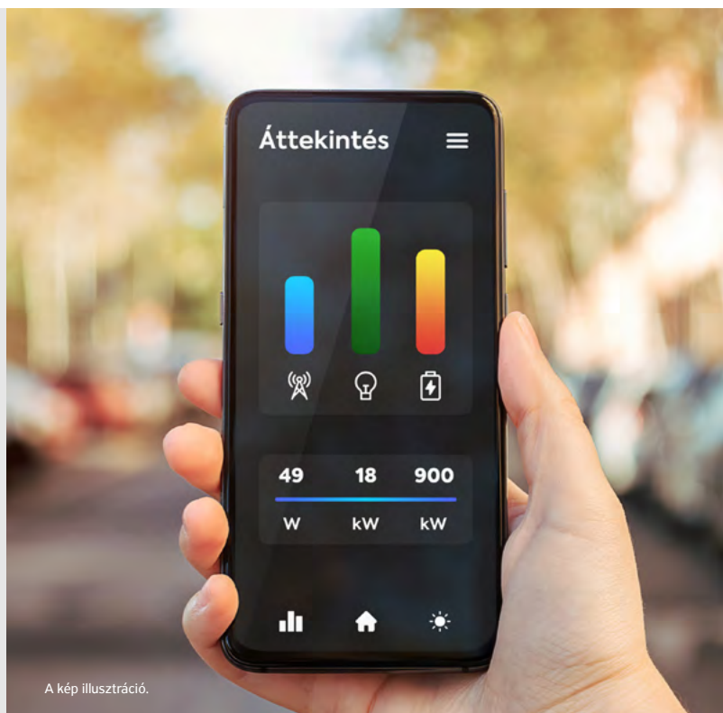
A kép illusztráció.